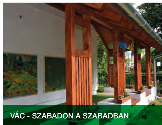
VÁC - SZABADON A SZABADBAN