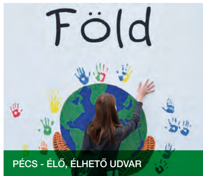
PÉCS - ÉLŐ, ÉLHETŐ UDVAR