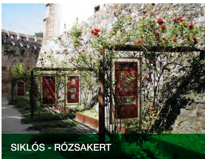
SIKLÓS - RÓZSAKERT