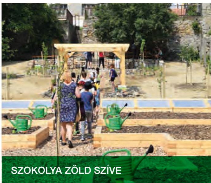
SZOKOLYA ZÖLD SZÍVE