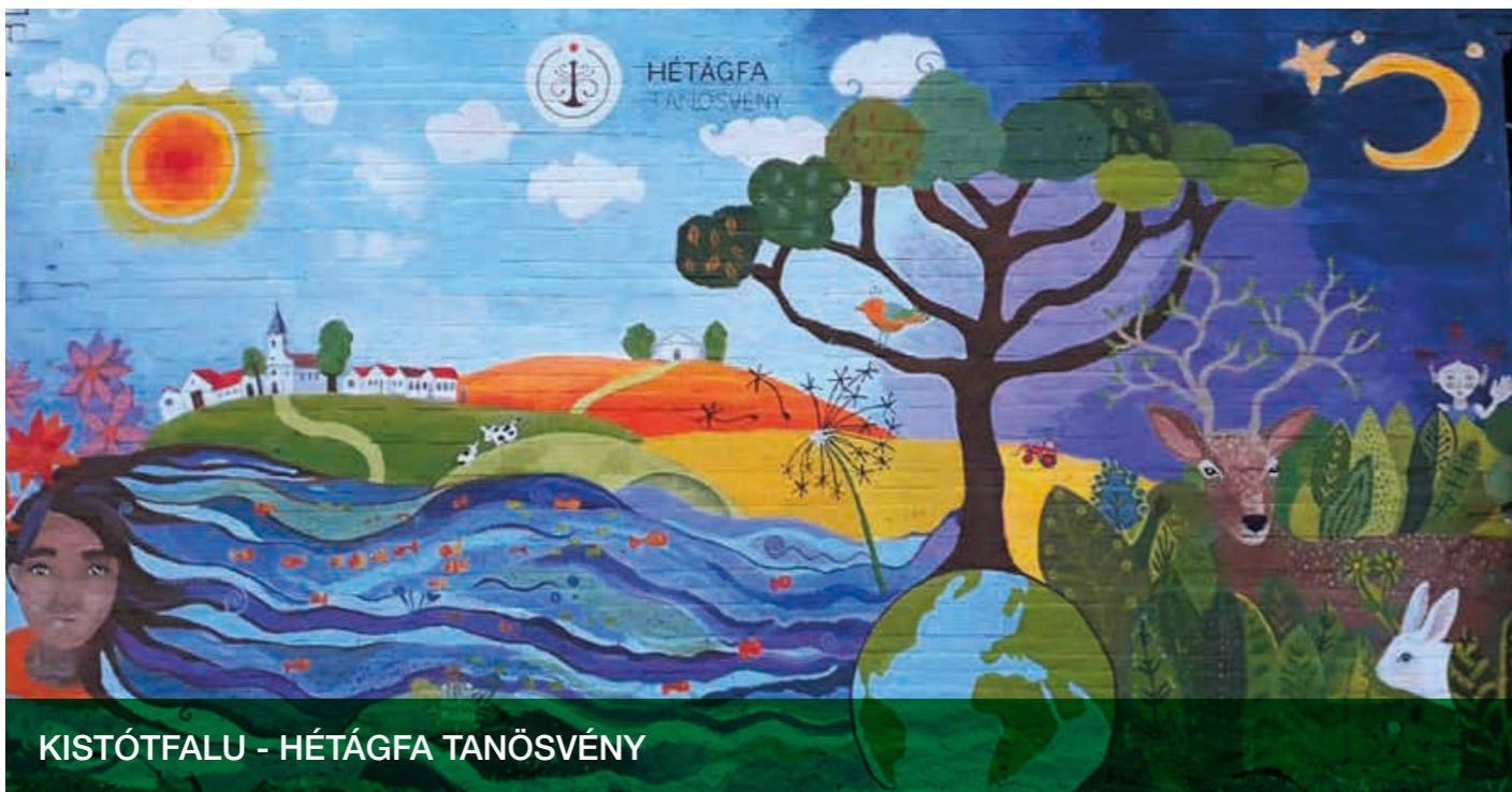
KISTÓTFALU - HÉTÁGFA TANÖSVÉNY